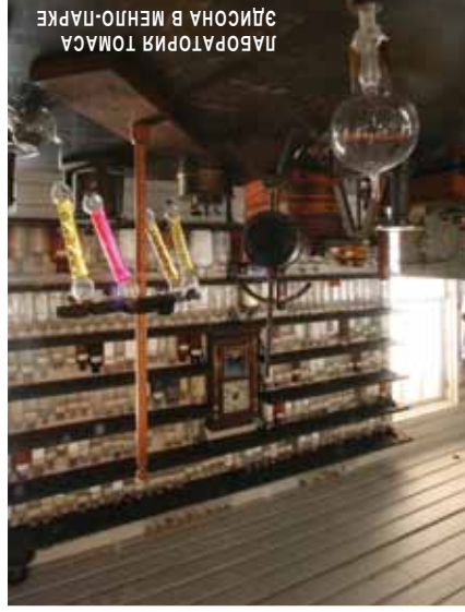
ЛАБОРАТОРИЯ ТОМАСА ЭДИСОНА В МЕНЛО-ПАРКЕ