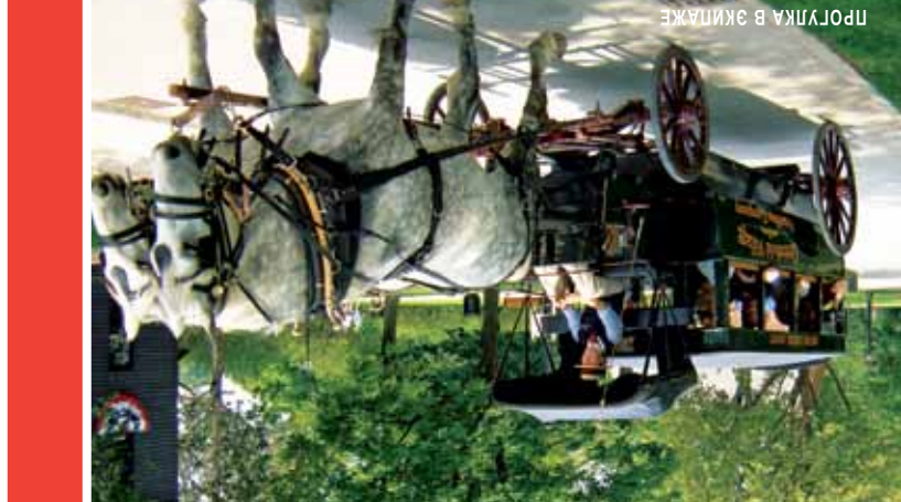
ПРОЕКТ В ЭКИПАЖЕ