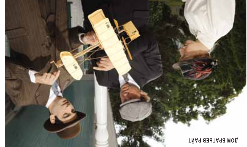
ДОМ БРАТЪЕВ РАЙТ

У НАС САМИЙ КЛАСНЫЙ ИСТОРИЧЕСКИЙ АТРАКЦИОН В АМЕРИКЕ! УВЕДИТЕЛЬ В ЭТОМ САМИ. Посетите наш выставочный площадки: Музей Генри Форда Экспресс по заводу Руж компании Ford Кинотеатр IMAX Исследовательский центр имени Бенсона Форда TheHenryFord.org