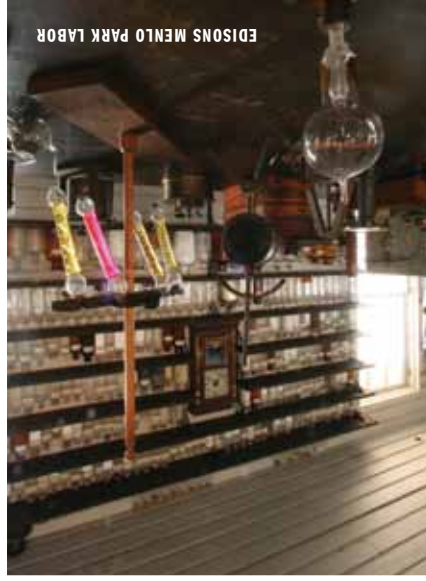
EDISON'S MENLO PARK LABOR