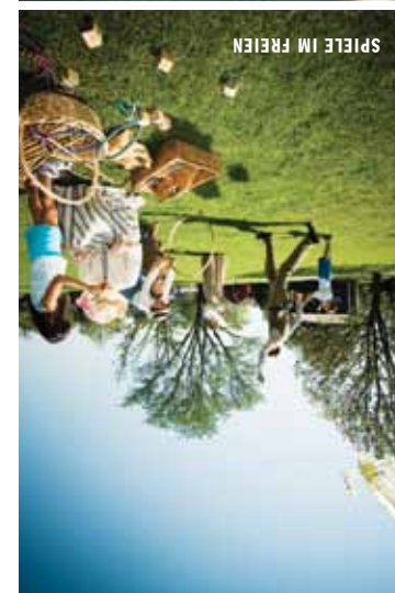
SPIELE IM FREIEN