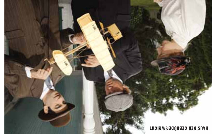
HAUS DER GEBRÜDER WRIGHT