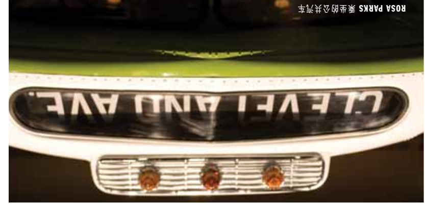
ROSA PARKS 乘坐的公共汽车

有鉴于 Model T 老爷车的成功，Henry Ford (亨利·福特) 一举成为美国的民族英雄，并拥有了巨大的财富和影响力。他开始着手收集物品，并且创建了一座博物馆、一座村庄、一所学校，展示美国的历史、智慧、丰富的资源、以及创新。如今，他创始于约 80 年前的机构已发展为五处名胜和数以百万计的工艺品，并被称为 The Henry Ford, America's Greatest History Attraction (亨利·福特，美国最伟大的历史名胜)。