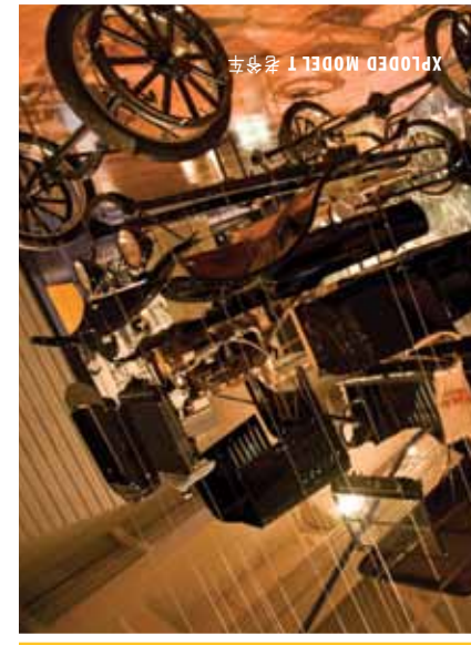
XPLORER MODEL T 老爷车