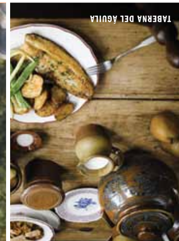
TABERNA DEL ÁGUILA