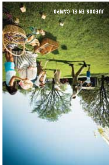
JUEGOS EN EL CAMPO