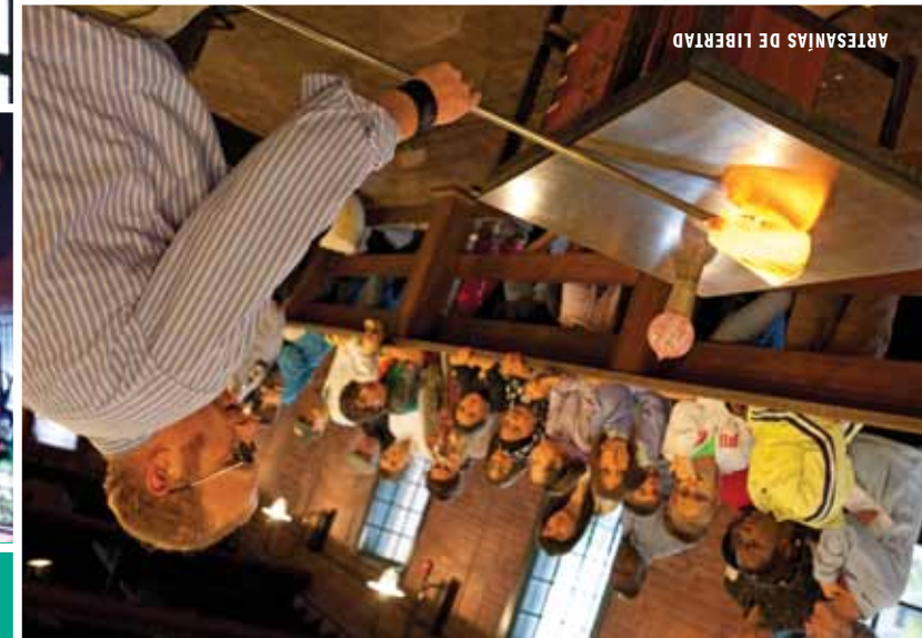
ARTESANÍAS DE LIBERTAD