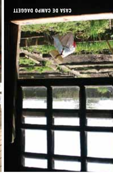
CASA DE CAMPO DAGGETT