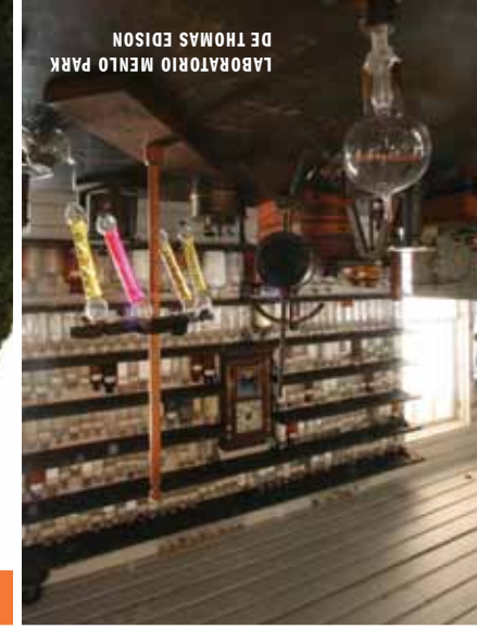
LABORATORIO MENLO PARK DE THOMAS EDISON