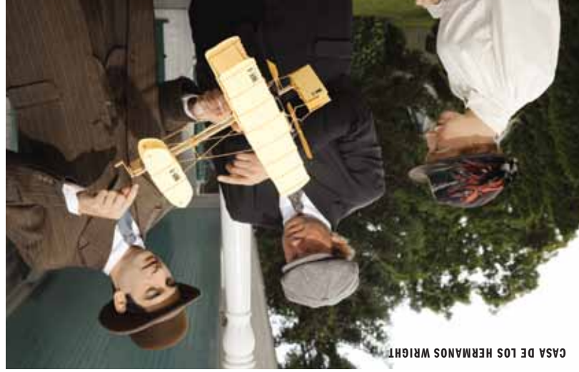
CASA DE LOS HERMANOS WRIGHT

El éxito del Modelo T convirtió a Henry Ford en un héroe estadounidense y en un hombre de admirable fortuna e influencia. Comenzó a coleccionar objetos y creó un museo, un pueblo y una escuela que exhibieron la historia, ingenuidad, iniciativa e innovación estadounidense. Hoy en día, la institución que inició hace casi 80 años creció y consta de cinco atracciones y millones de artefactos, y es conocida como The Henry Ford, la Atracción más grande de la historia estadounidense.